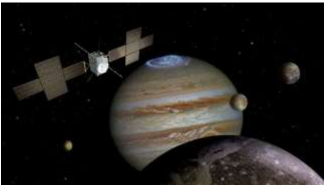
Die eurp. Raumsonde JUICE untersucht das Jupitersystem